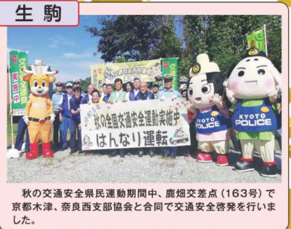
秋の交通安全県民運動期間中、鹿畑交差点(163号)で京都木津、奈良西支部協会と合同で交通安全啓発を行いました。