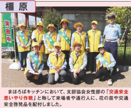
まほろばキッチンにおいて、支部協会女性部の「交通安全思いやり作戦」と称して来場者や通行人に、花の苗や交通安全啓発品を配付しました。