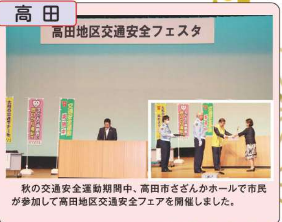
秋の交通安全運動期間中、高田市さざんかホールで市民が参加して高田地区交通安全フェアを開催しました。