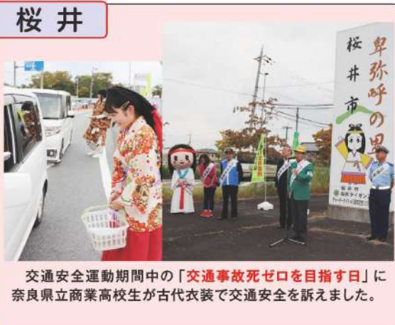
交通安全運動期間中の「交通事故死ゼロを目指す日」に奈良県立商業高校生が古代衣装で交通安全を訴えました。