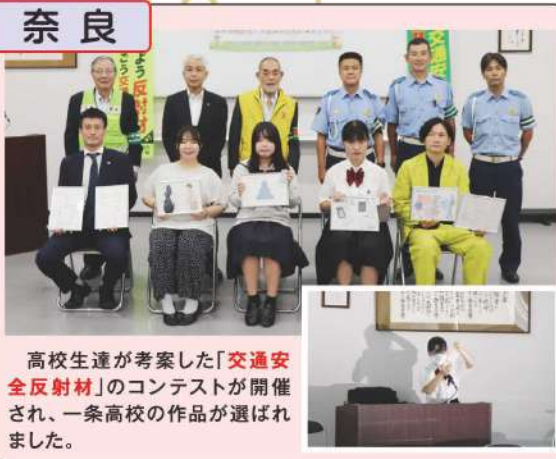
高校生達が考案した「交通安全反射材」のコンテストが開催され、一条高校の作品が選ばれました。