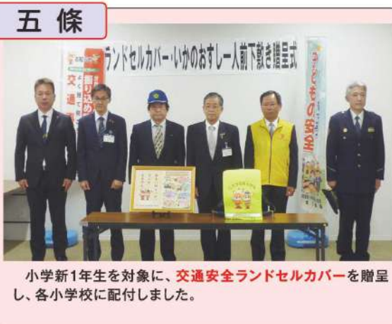
小学新1年生を対象に、交通安全ランドセルカバーを贈呈し、各小学校に配付しました。