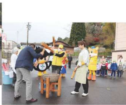
参加者による餅つき大会の様子