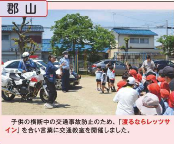
子供の横断中の交通事故防止のため、「渡るならレッツサイン」を合い言葉に交通安全教室を開催しました。