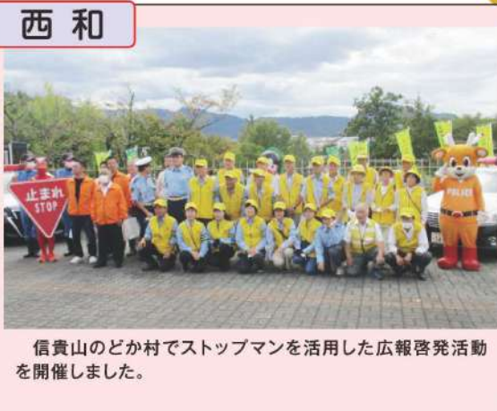
信貴山のどか村でストップマンを活用した広報啓発活動を開催しました。