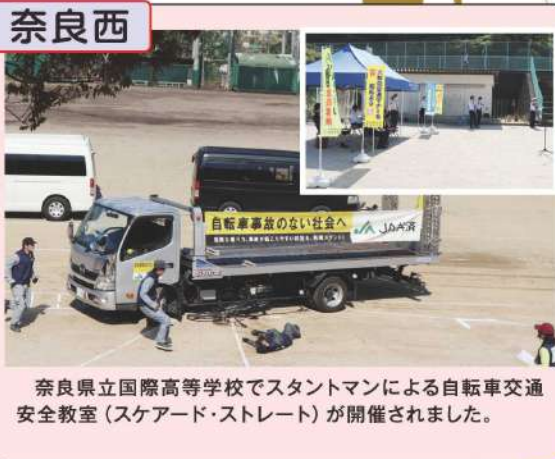
奈良県立国際高等学校でスタントマンによる自転車交通安全教室(スクエアード・ストレート)が開催されました。