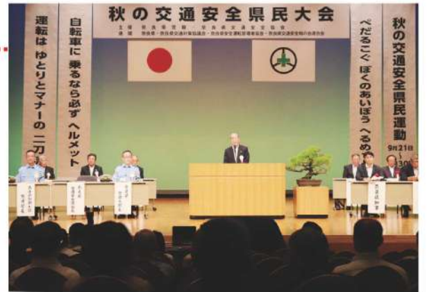
秋の交通安全県民大会での開催状況