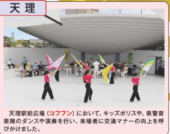
天理駅前広場(コフアン)において、キッズポリスや、県警音楽隊のダンスや演奏を行い、来場者に交通マナーの向上を呼びかけました。