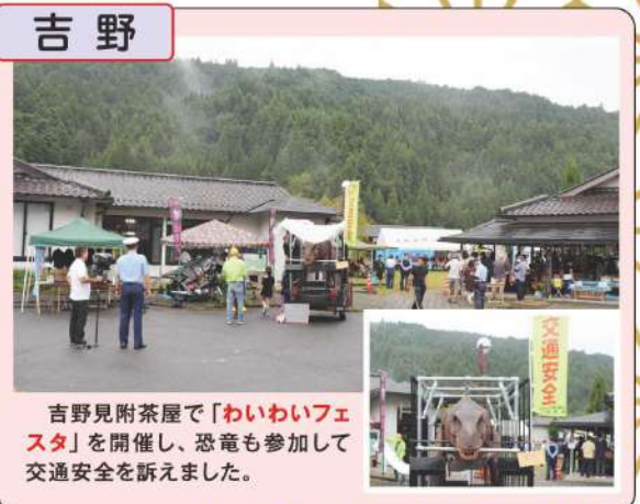
吉野見附茶屋で「わいわいフェスタ」を開催し、恐竜も参加して交通安全を訴えました。