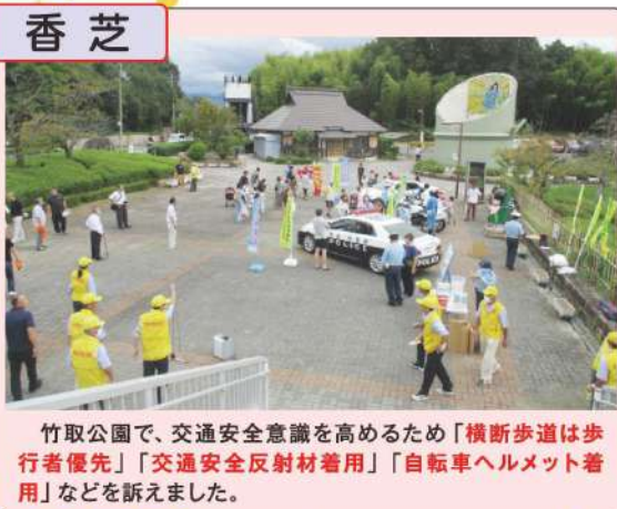
竹取公園で、交通安全意識を高めるため「横断歩道は歩行者優先」「交通安全反射材着用」「自転車ヘルメット着用」などを訴えました。