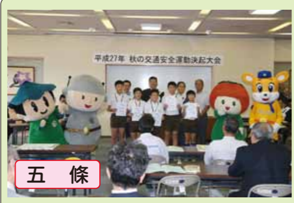
五條 子供自転車奈良県大会で優秀な成績を収めた牧野小学校の選手達が「子供自転車指導員」に指名されました