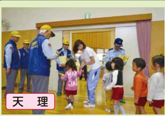
天理 都祁保育園で親子の交通安全教室を開催し、安全グッズをプレゼントして交通安全を呼びかけました