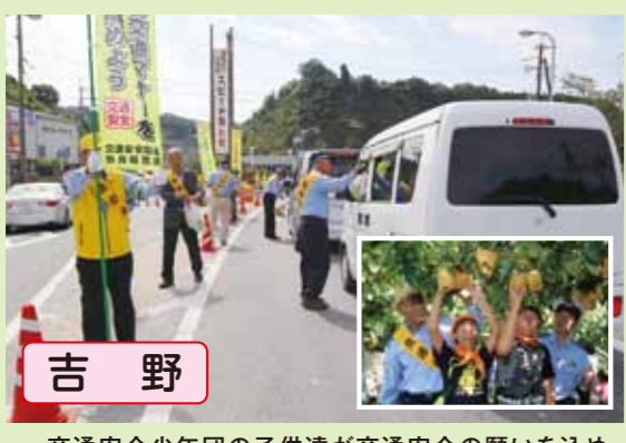
吉野 交通安全少年団の子供達が交通安全の願いを込めて育てた「交通事故ナン(梨)」をドライバーに配布し、安全運転を呼びかけました