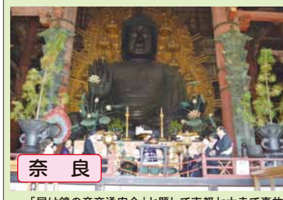
奈良 「届け鐘の音交通安全」と題して南都七大寺で事故の犠牲者を悼み梵鐘を鳴らし交通安全を呼びかける法要を行いました(写真は「東大寺」での法要)