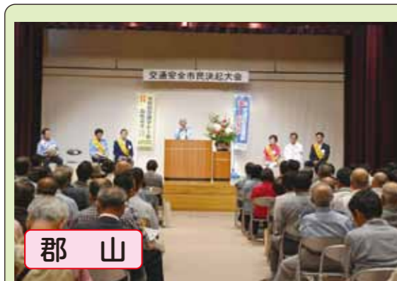
郡山 交通安全市民決起大会を開催し、功労者などの表彰や交通安全宣言を行いました。