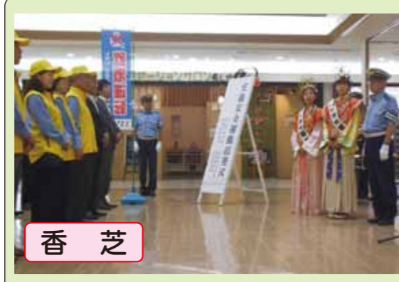
香芝 かくや姫に扮した畿央大学の学生が一日警察署長となって、安全運動の出発式を行いました