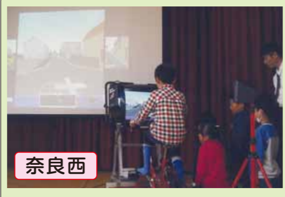
奈良西 奈良女子大附属小学校で「自転車シミュレーター」を使用した自転車交通安全教室を開催しました