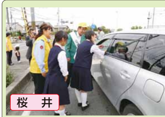
桜井 桜井高校の生徒が作成した交通安全マスコットをドライバーに配布し、安全運転を呼びかけました