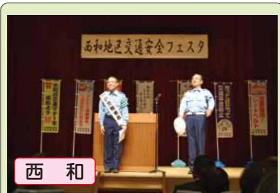
西和 交通安全フェスタを開催し、アナウンサーの三代澤康司さんを一日警察署長に委嘱して交通安全講話やパレードを行いました。