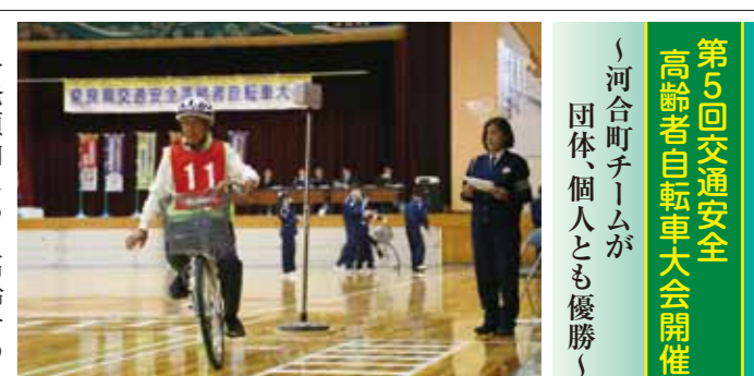
第5回交通安全高齢者自転車大会開催 河合町チームが団体、個人とも優勝

秋の交通安全県民大会での受賞 奈良県交通安全協会と奈良県警察は、9月18日かきはら万葉ホールにおいて「秋の交通安全県民大会」を開催し、平成27年度の交通安全功労者等の表彰と伝達を行いました。 この表彰等は長年にわたり交通事故防止に功績のあった方々を讃えるもので、今回次の197名の方と12の優良団体が及び10の優良学校が受賞されました。