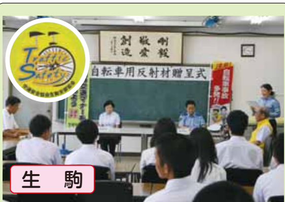
生駒 マナーアップ指定校の生駒高校で同校の生徒がデザインした「自転車用反射材」の贈呈を行いました