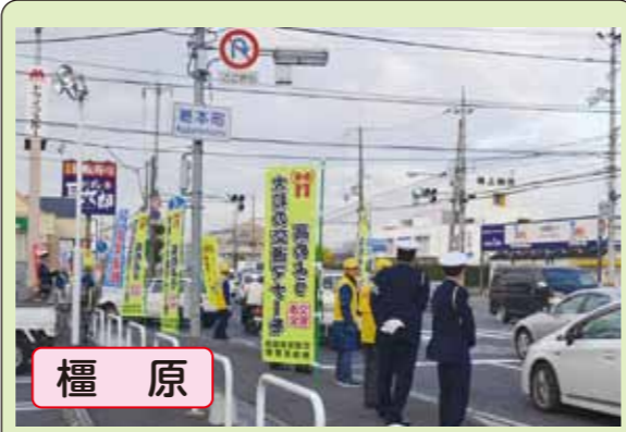
橿原 「大和の交通マナーを高めよう年末作戦」を実施、主要交差点で啓発物をくばりドライバーに安全運転を呼びかけました