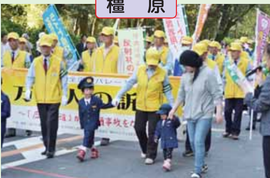
キッズポリスと神武祭のパレードに参加し反射材等を提供し交通安全を呼びかけました。