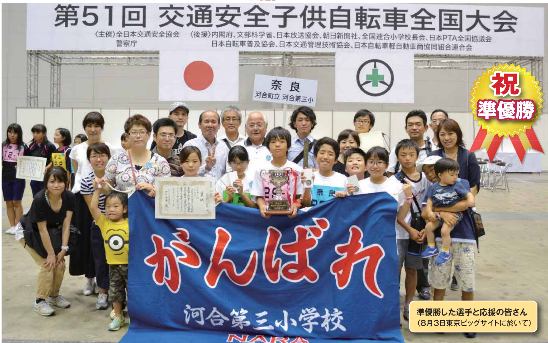
準優勝した選手と応援の皆さん (8月3日東京ビッグサイトに於いて)