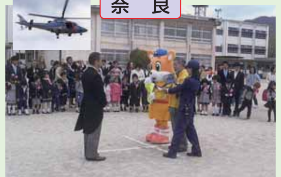
「空飛ぶランドセルカバー」奈良市立東市小学校で県警ヘリコプターを使用しランドセルカバーを贈呈しました。