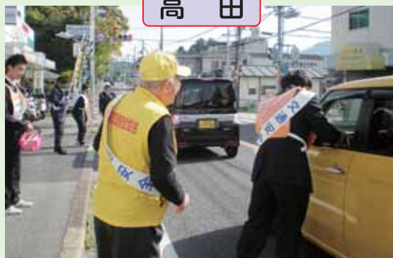
御所実業高校の生徒と共に、ドライバーに対して「全席シートベルト着用、早め点灯」を呼びかけました。