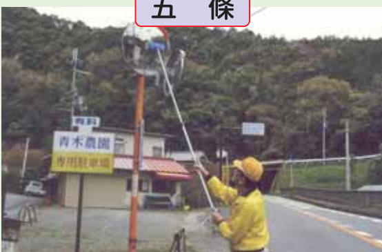
西吉野地区で交通安全を願いカーブミラーを清掃しました。