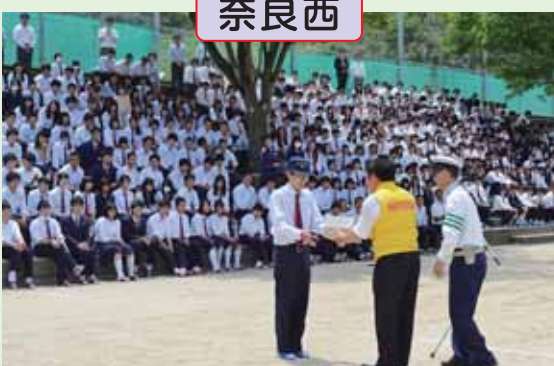
県立登美ヶ丘高校の自転車通学生へ「サイクルリフレクター」を贈呈しました。