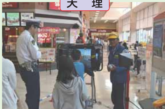
自転車事故防止のため、ザ・ビッグエクストラ天理店内で、自転車シミュレーターを利用し体験講習を実施しました。