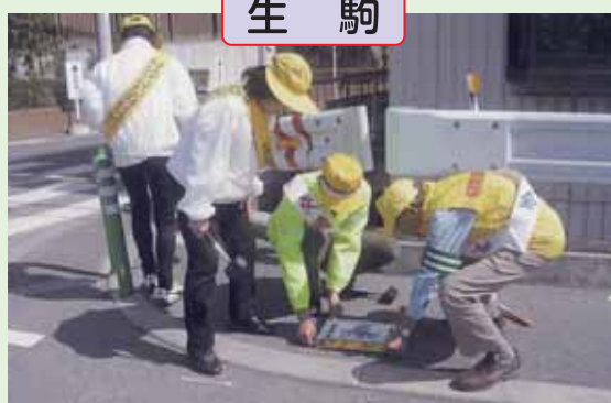
子供達の安全を願い通学路の点検を実施し危険箇所に「ストップマーク」を貼付しました。