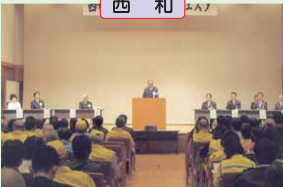
西和地区交通安全フェスタを開催。無事故・無違反を達成した16事業所を表彰しました。