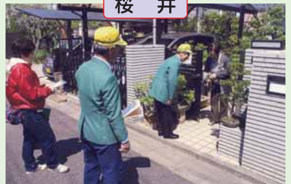
高齢者宅を訪問し反射材等を提供し外出時には「明るい服装・反射材の着用」を呼びかけました。