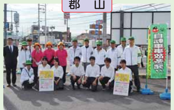
奈良学園高校の生徒と共に、自転車利用者に「反射材、レインコート等」を提供。事故防止を呼びかけました。