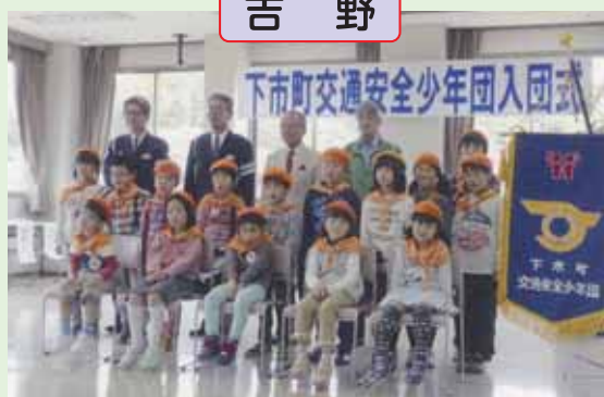
「下市町交通安全少年団」の入団式を行いました。