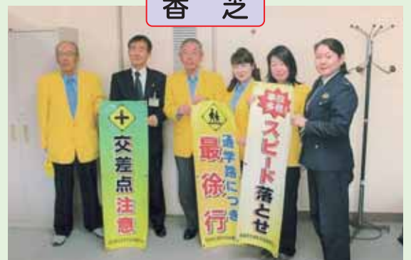
香芝市教育長に通学路安全対策として、電柱幕を贈呈しました。